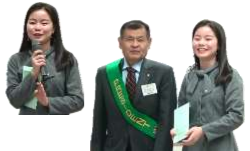
ロータリー米山記念奨学金贈呈

皆さんお久しぶりです。一ヶ月半ぶりに古河に来ました。今日は急に寒くなりましたが、お天気で良かったです。残り4ヶ月ほどになりますので、大事にして参りたいと思います。今後とも宜しくお願い致します。